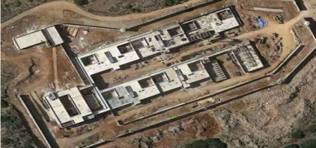
Εικόνα 2: Σωφρονιστικό Κατάστημα Κρήτη II, Κουρούνες Νεάπολης Λασιθίου (φωτογραφία από δημοσίευμα της 27ης Οκτωβρίου 2020 με τίτλο «Οι νέες φυλακές στην περιοχή “Κουρούνες”», πηγή: www.kritikaepikaira.gr/oi-nees-filakes-stin-perioxi-kourounes/ , ημερομηνία πρόσβασης: 22 Δεκεμβρίου 2022)