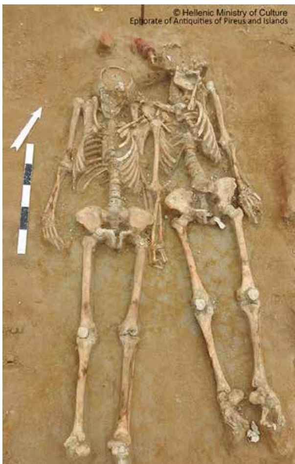
Εικ.8: Ταφή ζεύγους πιασμένοι από το χέρι.

την άποψη των κοινωνικών ζυμώνσεων και πολιτειακών μετασχηματισμών. Ιδιαίτερα ο 7ος και 6ος αι., κατά τη διάρκεια των οποίων το νεκροταφείο χρησιμοποιείται μαζικά, είναι εποχή κρίσης της αθηναϊκής κοινωνίας, όπου δεσπόζει μια ισχυρή αριστοκρατία και ένας μεγάλος αριθμός φτωχών ανθρώπων, συχνά στα όρια της εξαθλίωσης. Τα αιτήματα των τελευταίων αποτυπώνονται στις πρώτες προσπάθειες κωδικοποίησης του αθηναϊκού Δικαίου. Στην ύστερη αρχαϊκή περίοδο χωρικοί και άρχοντες συμμετέχουν σε παρατεταμένες συγκρούσεις που απορρέουν από τις διαφορές ανάμεσα στις αρχοντικές οικογένειες.