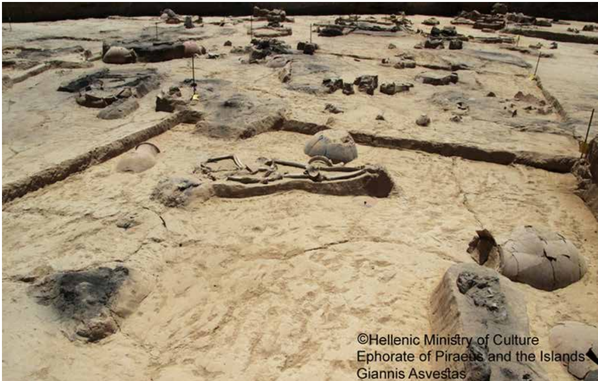
Εικ.2: Άποψη του τμήματος του νεκροταφείου κατά τη διάρκεια των εργασιών του Κέντρου Πολιτισμού Ίδρυμα Σταύρος Νιάρχος.

Περίπου οι μισές από αυτές είναι ταφές βρεφών και μικρών παιδιών οι περισσότερες σε αγγεία (εγχυτρισμοί). Οι ενήλικοι θάβονται με πολλούς και διαφορετικούς τρόπους. Ο συχνότερος τρόπος είναι ο ενταφιασμός μέσα σε ένα πρόχειρα διαμορφωμένο λάκκο, ενώ σε αρκετές περιπτώσεις ο λακκος επενδύεται με τοπικούς πλακοειδείς λίθους διαμορφώνοντας ένα «κιβωτιόσχημο» τάφο, εντός του οποίου τοποθετείται ο νεκρός. Δεν λείπουν, βέβαια, οι πυρές για την καύση του νεκρού, στις οποίες παρατηρούνται διαφοροποιήσεις: ενίοτε εντός ορύγματος τοποθετείται η νεκρική κλίνη μαζί με την καύσιμη ύλη και σε άλλες περιπτώσεις διαμορφώνεται με πήλινες πλίνθους ένας ορθογώνιος τάφος εντός του οποίου καίγεται το νεκρό σώμα. Ιδιαίτερο ενδιαφέρον παρουσιάζει η κατά τόπους παρουσία ταφών αλόγων ανάμεσα στις ταφές των ανθρώπων (Εικ.3).