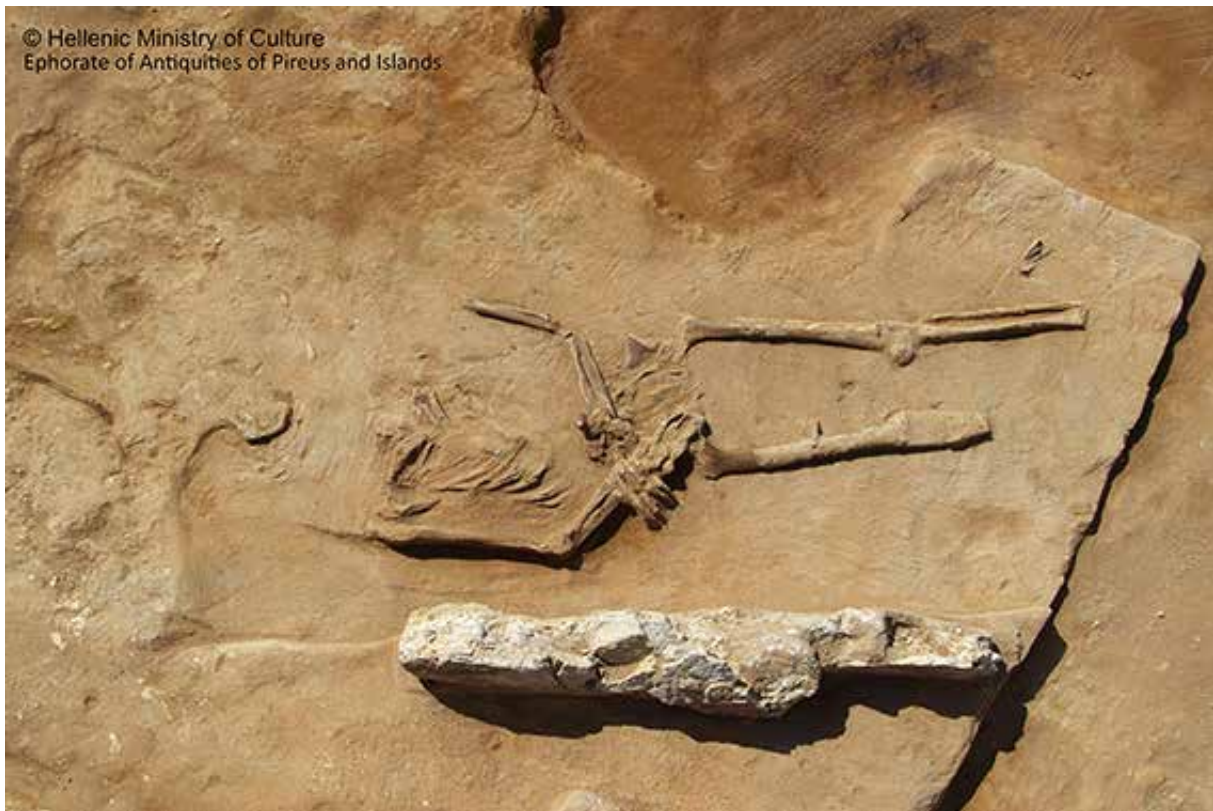
Εικ.6: Ατομική ταφή βιαιοθάνατου.

Τα ευρήματα από το νεκροταφείο του Φαλήρου δίδουν μία εναργή εικόνα των συνθηκών της ζωής των κατοίκων της Αθήνας κυρίως σε μία εποχή –την αρχαϊκή- που λίγα πράγματα γνωρίζουμε για την πόλη. Τα συγκλονιστικά παραδείγματα των βιαιοθανάτων είτε πρόκειται για τις μεμονωμένες είτε για τις ομαδικές ταφές ως αποτελέσματα βιαιοπραγιών μας οδηγούν στους δυσερμήνευτους διαδρόμους της ιστορίας της πολιτειακής εξέλιξης του Άστεως αλλά και στην ακόμη σκοτεινότερη διαδρομή του Δικαίου που συνυφαίνεται με το Πολίτευμα. Ποια ήταν η σχέση ένοχης πράξης και τιμωρίας; Ποιοί καταδικάστηκαν για αξιόποινες πράξεις και ποιοι για κοινωνικές εξεγέρσεις; Σε ποιους άγραφους και στην συνέχεια κωδικοποιημένους από τον Δράκοντα και τον Σόλωνα νόμους αντιστοιχεί η κάθε τιμωρητική πράξη; (Εικ.6)