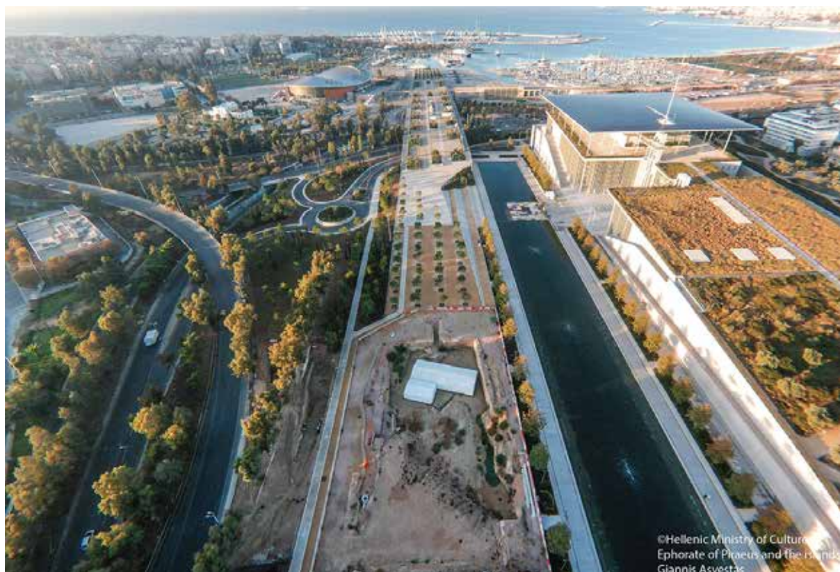
Εικ.1: Το Φαληρικό Δέλτα σήμερα, στα αριστερά η Λεωφόρος Συγγρού, στο μέσον η ανασκαφή της ανασκαφικής περιόδου 2016-2020 και στο βάθος ο φαληρικός όρμος.

Όσο κοντά όμως κι αν βρίσκεται – σε απόσταση περίπου 7 χιλιόμετρα από την Ακρόπολη- το λιμάνι του Φαλήρου δεν παύει να είναι ένα ανθρωπογεωγραφικό όριο για τους αθηναίους