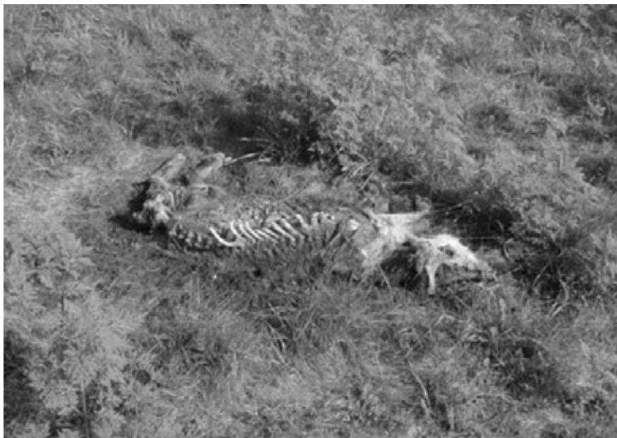
Εικ. 4. Πτώμα χοίρου σε αποσύνθεση ( Sus scrofa L. ) και σχηματισμός Cadaver Decomposition Island (CDI). [Soil Analysis in Forensic Taphonomy. Chemical and Biological Effects of Buried Human Remains, (Eds) Tibbett M. and Carter D.O., CRC Press Taylor & Francis Group, Boca Raton, London, New York, Carter and Tibbet 2008, p. 37]