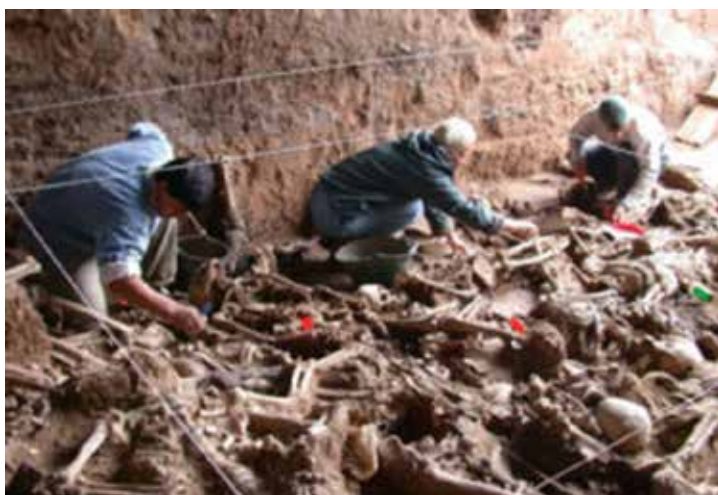
Εικ. 5. Ειδικοί από την Ομάδα Δικαστικής Ανθρωπολογίας της Αργεντινής, ανασκάπτουν (με εφαρμογή καννάβου) ομαδική ταφή με 1049 άτομα εκτελεσμένα από το δικτατορικό καθεστώς. Ανευρέθη το 1990 πλησίον του São Paulo και είναι γνωστή ως Vala Clandestina de Perus.