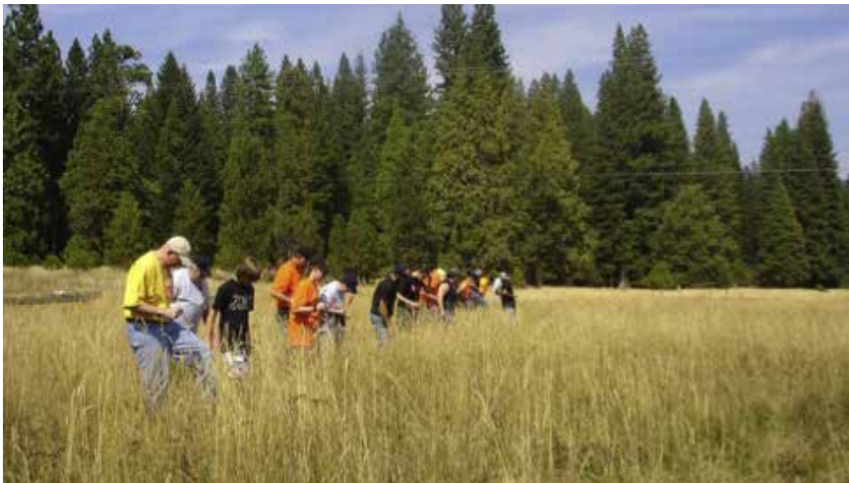
Εικ.1: Line search [Christensen A.M., Passalacqua N.V. and Bartelink E.J. 2014, "Forensic Anthropology. Current Methods and Practice", Elsevier, USA, p. 154]

Dr habil. Αρχαιολογίας, (Εφορεία Αρχαιοτήτων Πειραιώς και Νήσων / Υπουργείο Πολιτισμού και Αθλητισμού)