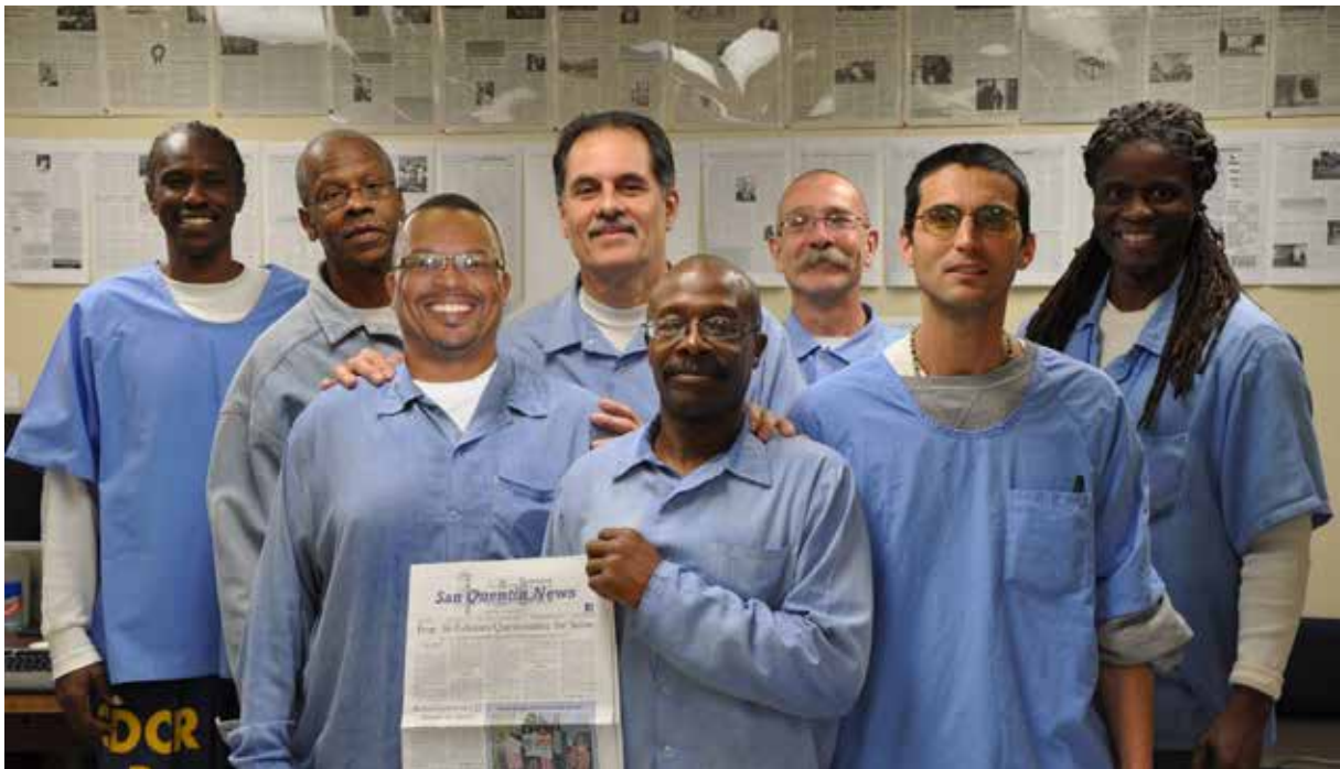
The newsroom at San Quentin News.

ΜΠΣ «Εγκληματολογία & Αντεγκληματική Πολιτική» ΕΚΠΑ